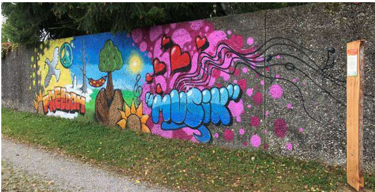
Das Graffiti zum Thema Jugend auf dem Meditationsweg in Welden, einem von zehn Kleinprojekten, die über das Regionalbudget 2020 gefördert wurden.