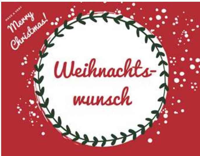
Die Wunschkarten der Aktion „Christkind gesucht 2020“

Mit der Aktion „Christkind gesucht“, die bereits 2019 im Markt Welden stattgefunden hat, möchten wir Ihnen die Gelegenheit geben, den Klienten der Tafel Welden, Geflüchteten sowie den Seniorinnen und Senioren der regionalen Seniorenheime einen kleinen Wunsch zu erfüllen!