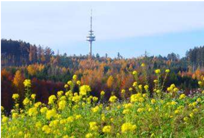
4 Beispiel für ein eingereichtes Foto: Sebastian Bernhard: Dillackerfeld in Heretsried mit Blick auf den Fernsehturm Bonstetten

Wir sind überwältigt! Am Fotowettbewerb haben 26 Personen teilgenommen und uns mehr als 210 Fotos aus der Region Holzwinkel und Altenmünster geschickt. Über den Wasservogelbrauch bis hin zu Kapellen, Bildstöcken und Biotopen... Wir haben eine Bandbreite an tollen Bildern erhalten, die unsere schöne Region abbilden. Vielen herzlichen Dank für die zahlreichen Zusendungen!