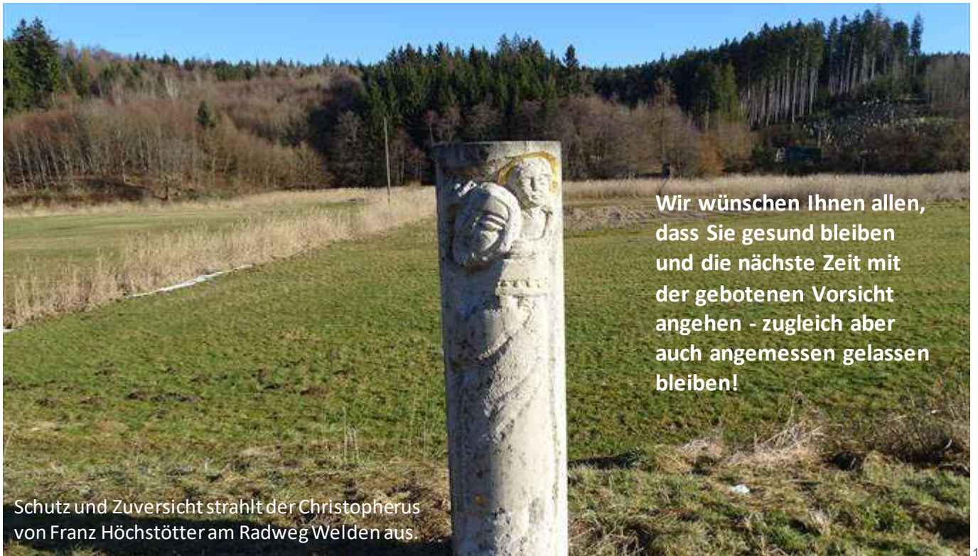
Schutz und Zuversicht strahlt der Christopherus von Franz Höchstötter am Radweg Welden aus.

Wir wünschen Ihnen allen, dass Sie gesund bleiben und die nächste Zeit mit der gebotenen Vorsicht angehen - zugleich aber auch angemessen gelassen bleiben!