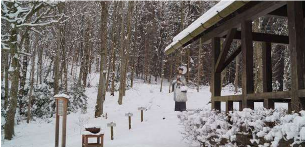
Winterwonderland im Holzwinkel und Altenmünster: Station des Ludwig Ganghofer Lausbubenwegs im Schnee.